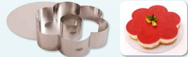
Art.-Nr.: 24938 Anemone + Frankfurter Kranz 70 mm + Tortenhelfer

vom 25. Februar 2019 bis zum 24. März 2019