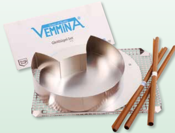
Art.-Nr.: 9347 Tiger Set

EUR 29,90 SFR 38,90 statt 36,80 statt 47,90