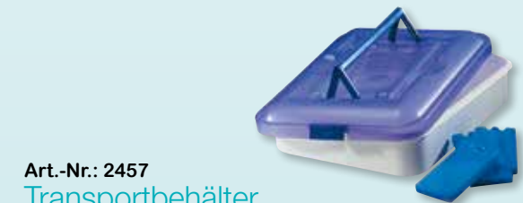
Art.-Nr.: 2457 Transportbehälter

EUR 114,50 SFR 148,90 statt 133,80 statt 173,90