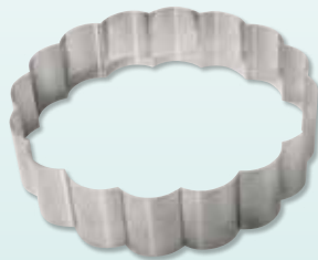
Art.-Nr.: 263 Passionsblume

Diese Backform (aus Edelstahl) besitzt 16 Bögen und ist dadurch einfach in passende Kuchenstücke einteilbar, Höhe 70 mm. Die Passionsblume ist für 28er Rezepturen geeignet.