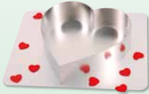
Art.-Nr.: 24937 Muttertagsherz + Schnittenhelfer

vom 31. Dezember 2018 bis zum 27. Januar 2019